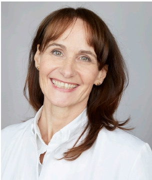
Leitende Ärztin DRK Kliniken Berlin Westend Brustzentrum